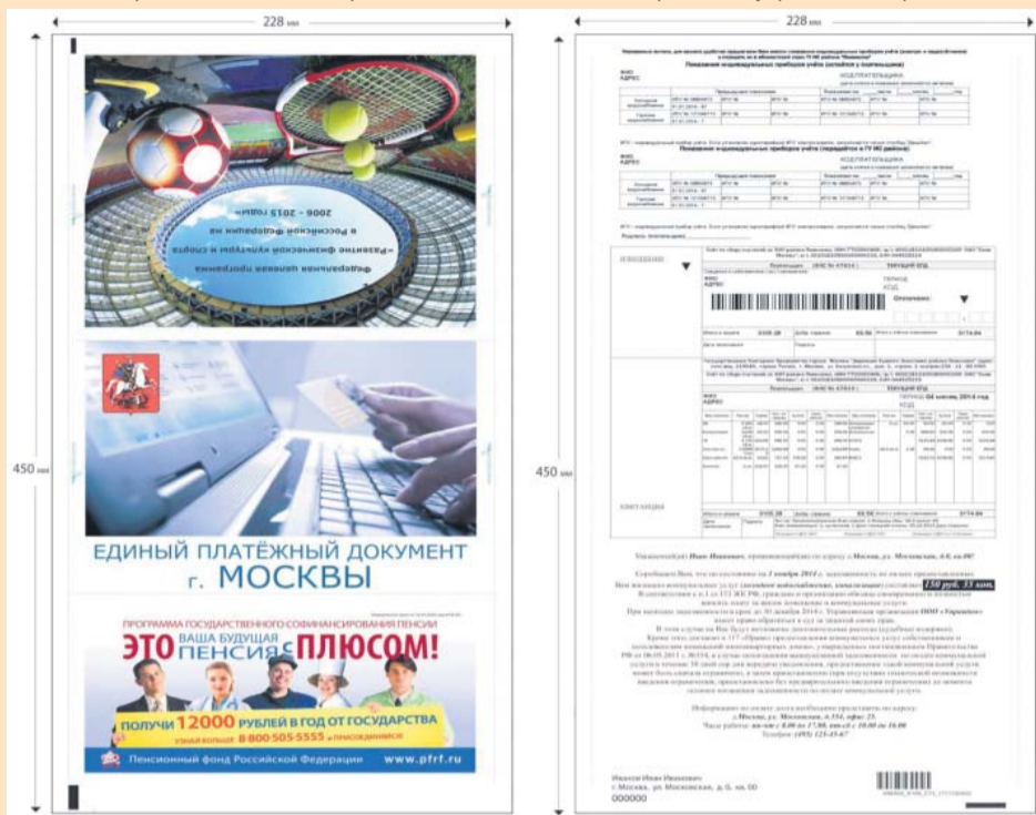
Образец ЕПД в собранном виде

Уважаемые москвичи! Обращаем Ваше внимание, что с 1 января 2015 года изменятся формат и внешний вид Единого платежного документа (ЕПД)! При возникновении сомнений в подлинности ЕПД, обращайтесь за разъяснениями в ГКУ ИС/МФЦ района.